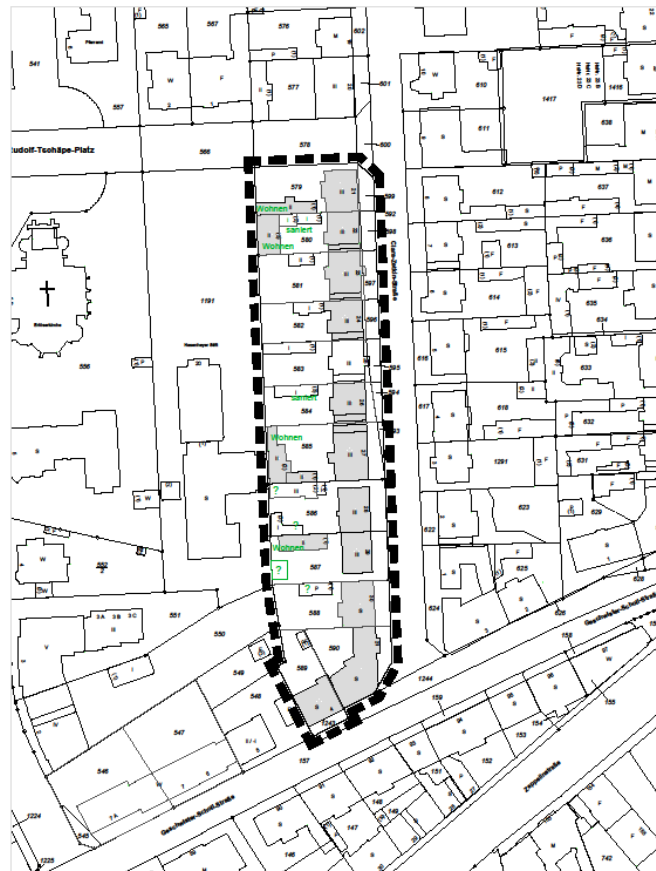
Übersichtskarte: Teilbereich südwestliche Clara-Zetkin-Straße

Grundstücksgrenze ausgewählt. Erkennbar sind hier Tendenzen zu einer stärkeren Verdichtung der hinteren Grundstücksflächen.